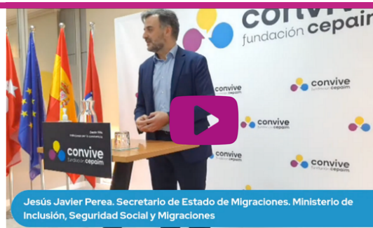
Jesús Javier Perea. Secretario de Estado de Migraciones. Ministerio de Inclusión, Seguridad Social y Migraciones

A la apertura del centro ubicado en la calle Luisa Muñoz nº 6 asistieron representantes del Ministerio de Inclusión, Seguridad Social y Migraciones.