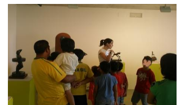
Foto: Visita al Muram.

"El Museo Regional de Arte Moderno (MURAM) como museo público, sirve a la comunidad multicultural de la que forma parte y uno de sus objetivos es conseguir su mejora global, desde el arte, el patrimonio y la cultura. Cuando el Proyecto de intervención Comunitaria Intercultural, se puso en contacto con nosotros, vimos la oportunidad perfecta para conseguirlo. Gracias a esta Escuela Abierta de verano comenzamos a afrontar este reto de forma comunitaria y esperamos que sea sólo el inicio de una "larga amistad" en todos los sentidos para poder seguir colaborando y disfrutando del proceso. ¡Juntos somos mejor!" MURAM