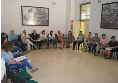
Foto: técnicos y ciudadanía organizando la Esc. abierta de verano.

Para hablar de la Escuela abierta de verano, lo mejor es dejar hablar sus actores.