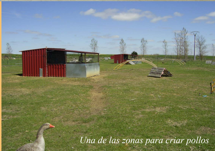
Una de las zonas para criar pollos