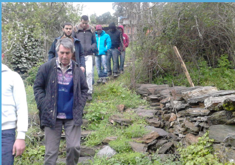
Con el grupo durante la visita a otras huertas