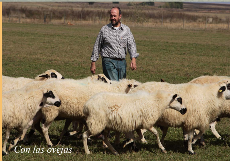
Con las ovejas