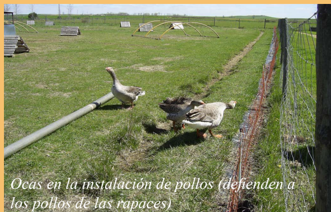
Ocas en la instalación de pollos (defienden a los pollos de las rapaces)