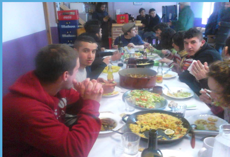
Comiendo con los jóvenes de Horuelo

Y tuvimos la visita de algunos amigos y amigas financiadores y colaboradores del proyecto. Los que se han decidido a venir a vernos han podido palpar todo esto que os cuento. Han comprendido un poco más el proyecto y sus razones, el modelo educativo que proponemos, como se emplean los dineros, etc. Y nosotros hemos disfrutado con la presencia de todos ellos. Muy entrañable la visita de los y las jóvenes de Horuelo.