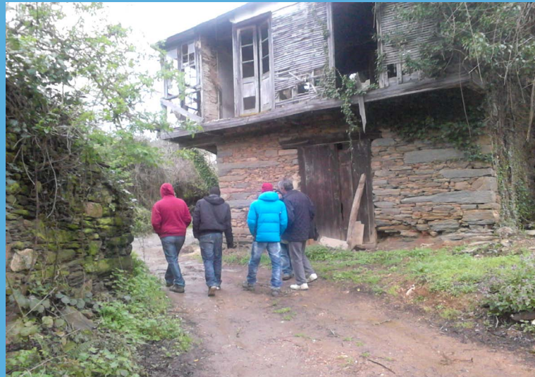
Por las calles de Tronceda conociendo experiencias