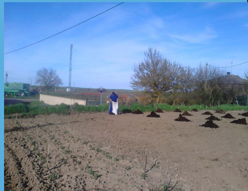
Finalizando la preparación para pasar el motocultor