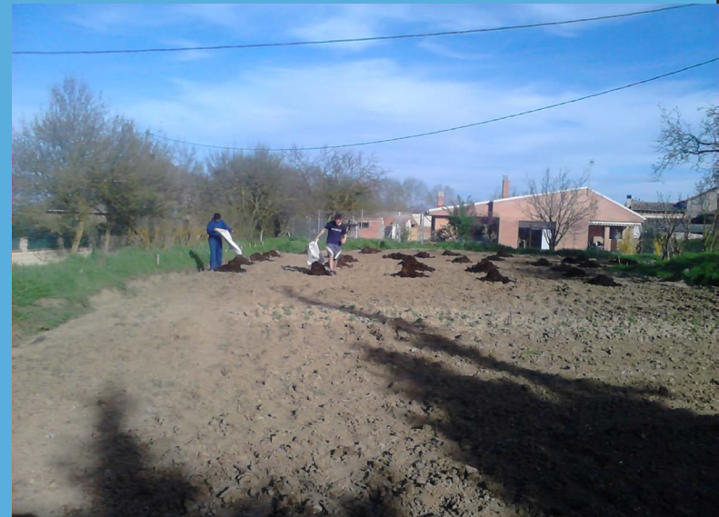
Preparando el terreno de la huerta

Plantamos los ajos y las habas en nuestro huerto, pero ha sido imposible hacer más, por culpa de la persistente y atípica lluvia que no nos ha abandonado en estos dos meses. A ver si nos da un respiro y continuamos sembrando las verduras que tocan.