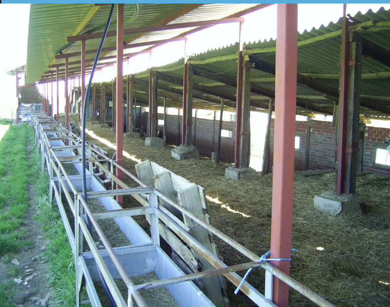
Instalación en la Granja de Jerónimo Aguado (Jeromo)