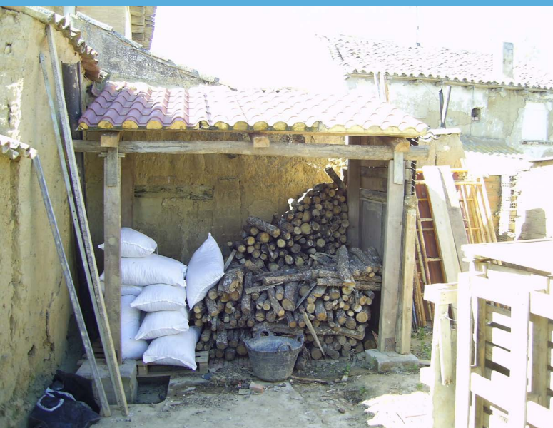
El leñero ya en uso

Terminado el Leñero, ahora hemos construido nuestro Gallinero en el que criaremos unas 15 gallinas y algunos pollos para autoconsumo. Lo hemos hecho de adobe y cimientos de piedra.