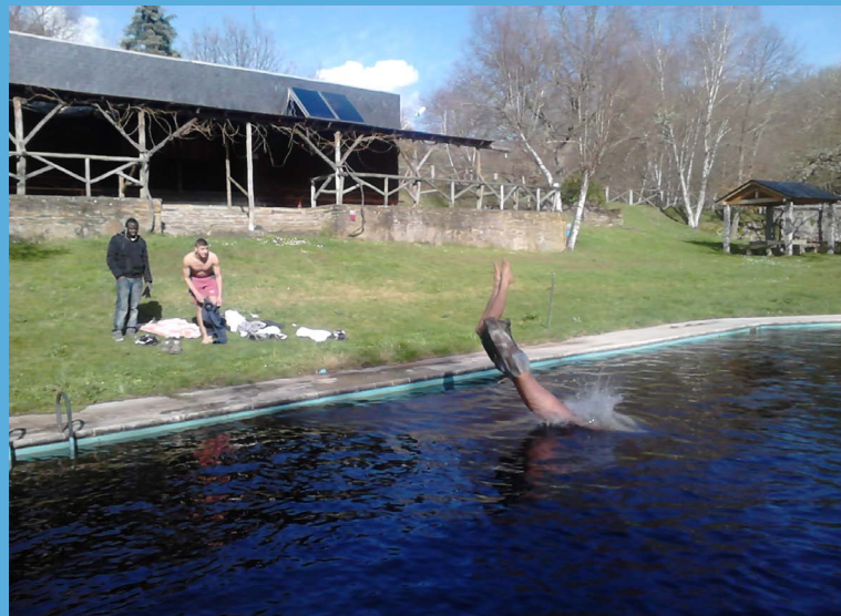
No todo ha sido trabajo en las visitas culturales