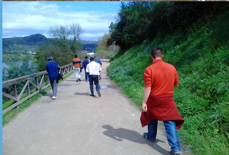
Trabajando con "Sicología Próxima"